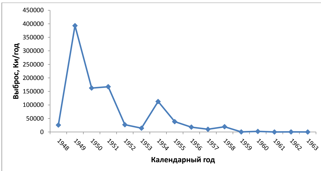
Рисунок 2 – Результаты реконструкции годовых выбросов ^{131}\text{I} в атмосферу из труб радиохимического завода за период 1948–1963 гг. (наиболее вероятные оценки) (Глаголенко, 2008)

Таким образом, можно предположить, что дозовая нагрузка на лиц, проживавших в детском возрасте вблизи ПО «Маяк» и подвергавшихся радиационному воздействию за счет выбросов ^{131}\text{I} , изменялась в соответствии с динамикой объемов выбросов и зависела от достигнутого возраста, года начала и длительности периода проживания в г. Озерске. Следовательно, лица, начавшие проживать в городе в одном возрасте, календарном году и одинаковое количество лет, потенциально могли получить аналогичную по величине дозу облучения ^{131}\text{I} . Тогда влияние радиационного фактора будет отражено в показателях заболеваемости раком щитовидной железы. Для проверки этого предположения, была проведена оценка различий заболеваемости РЩЖ среди лиц исследуемой когорты, проживавших в детском возрасте в г. Озерске в 1948–1952 гг., 1953–1962 гг. и после 1963 г., по показателям стандартизованного относительного риска заболеваемости по сравнению с национальной и региональной статистикой. В связи с тем, что треть членов субкогорты 1948–1962 гг. начала проживания в г. Озерске были активно обследованы на наличие тиреопатологии во время скринингового исследования в 2004–2009 гг., с целью исключения эффекта скрининга в модель оценки стандартизованных показателей была включена переменная, с помощью которой учитывались различия показателей заболеваемости в годы проведения обследования и вне этого периода. Результаты оценки СОР представлены в таблицах 5 – 8.