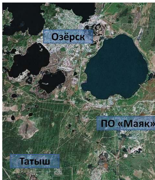
Рисунок 1 – Географическое положение собственно г. Озерска и поселка Татыш относительно ПО «Маяк»

Метод «случай–контроль в когорте» был использован для сравнения заболеваемости РЩЖ у жителей двух районов г. Озерска (собственно города и поселка Татыш), предположительно подвергавшихся радиационному воздействию в различной степени из-за особенностей питания. В соответствии с методикой проведения таких исследований (Breslow, 1987, Rothman, 2008) в группу «случаев» были отобраны все лица, заболевшие раком щитовидной железы в период с 1948 по 2009 год. Для каждого человека из группы «случаев» случайным образом из Детского регистра было отобрано по четыре человека в группу «контролей», которые на момент установления диагноза у «случая» были живы и не имели онкологических заболеваний других локализаций и должны были совпадать со «случаями» по полу, году рождения ( \pm 1 год), году въезда в г. Озерск ( \pm 1 год), месту рождения (родился в г. Озерске или приехал в город в возрасте до 15 лет) так, чтобы единственным различием между группами был изучаемый фактор – первый адрес проживания человека на момент рождения или въезда в город. Таким образом, была сформирована группа из 77 «случаев» (15 мужчин, 62 женщины) и группа из 308 «контролей» (60 мужчин и 248 женщин).